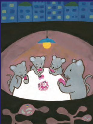
絵と文 坂本由香里

節電と言っても不便なことはかりではありませんね。楽しく節電する方法を皆で話し合 うのもまた新しい家族団欒の方になるのかも しれません。